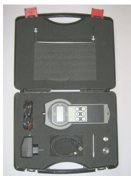
Měřicí souprava MV-5, MV-5L