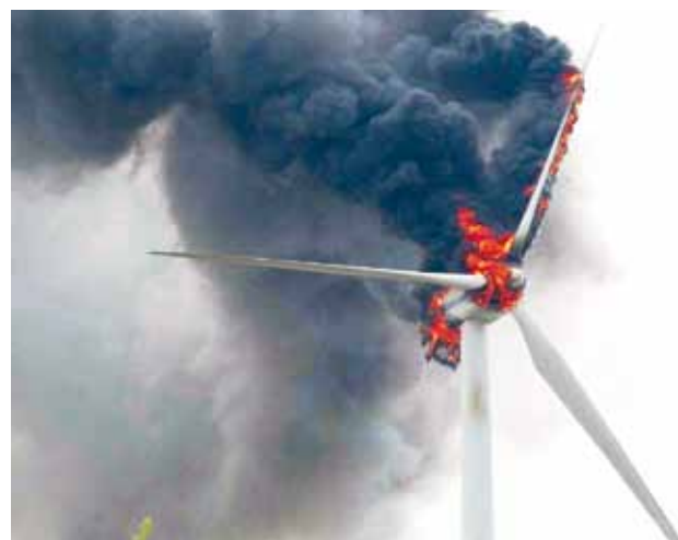
Tady už je na diagnostiku pozdě ...

Překvapivý vliv na opotřebenění systému má také natáčecí a brzdny systém VE. V souvislosti se snahou udržet optimální natočení vrtulového systému vůči větru a dynamickými rázy při jeho natáčení a brzdění vzrůstá opotřebenění hřídelového systému a snižuje se životnost nosných prvků.